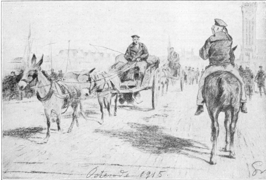
Stimmungsbild aus Ostende: Bei unseren feldgrauen „blauen Jungens“. Nach einer Zeichnung des Sonderzeichners der „Illustrierten Zeitung“ Fritz Grottemeyer.

Das zumindest entnehme ich einem Bild eines Illustrierten-Zeichners, der im Jahre 1916 in den Straßen von Oostende neben den durch H. Piper überlieferten Eselgespannen (die danach aber mit zwei Eseln bespannt waren!) auch einen berittenen Matrosen angetroffen hat und dieses Bild festhaltenswert fand.